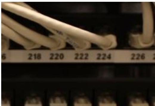
Figur 5 Merking i koplingspanel for spredenett

nnn angir samme løpenummer som på TO ved arbeidsplass.