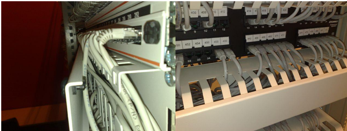
For trang kabelguide